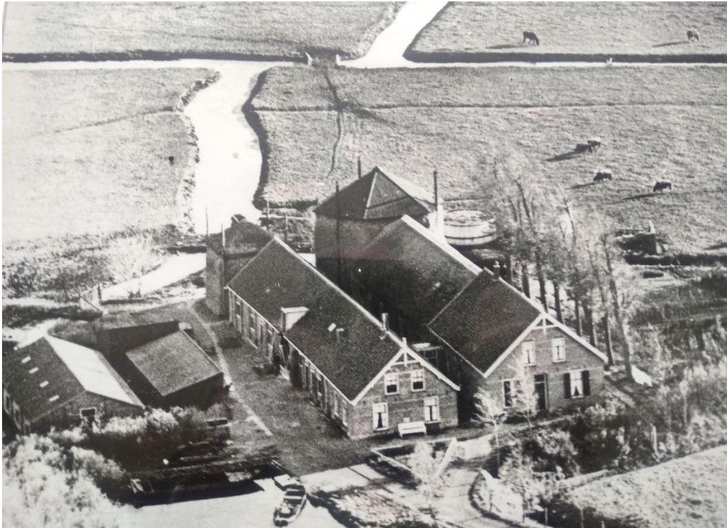
Boerderij aan de Zuidvenne (Van der Hulst).

onmogelijk op een behoorlijke wijze zijn bouwerij kunnen 'exerceren' als hij enige landerijen zou moeten verkopen. *7)