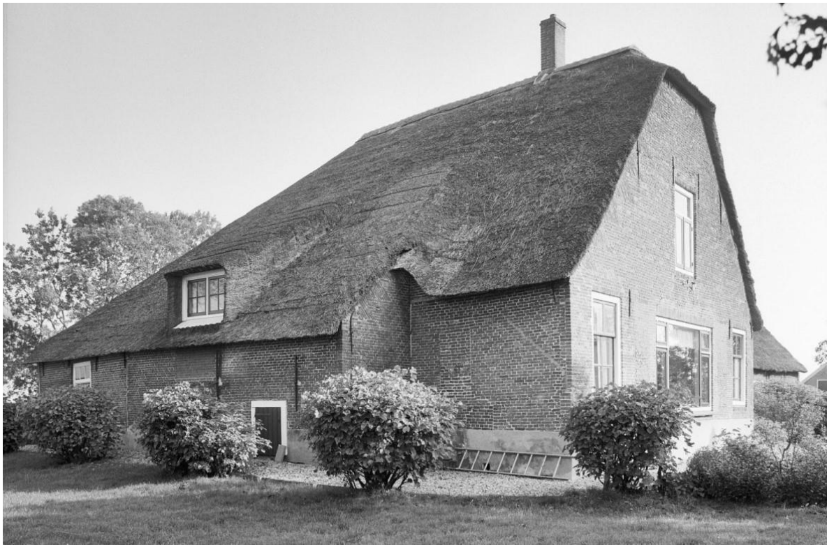
De huidige Moppehoeve.