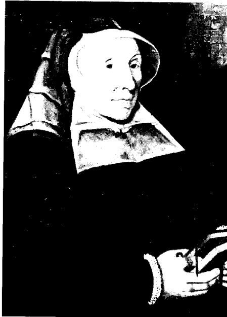
Portretschilderij uit de 16 e eeuw van de abdis Elburg van de Boetselaer van de Langerack in de kleding van een Benedictines.

augustus 1582 weten dat haar verzoek in overweging was genomen, maar dat er veel goederen van de abdij waren verkocht. Tot nader order werden deze verkopen gestaakt. Nog vóór de prins op 10 juli 1584 in Delft werd vermoord, was het verzoek van de abdis ingewilligd. De abdisgoederen werden aan de abdis en de andere vrouwen ter beschikking gesteld. De jurisdictie en de heerlijkheid Rijnsburg behoorden als vanouds aan de abdij zodat de vrouwen er weer als Vrijvrouwen hun soevereine macht kregen.