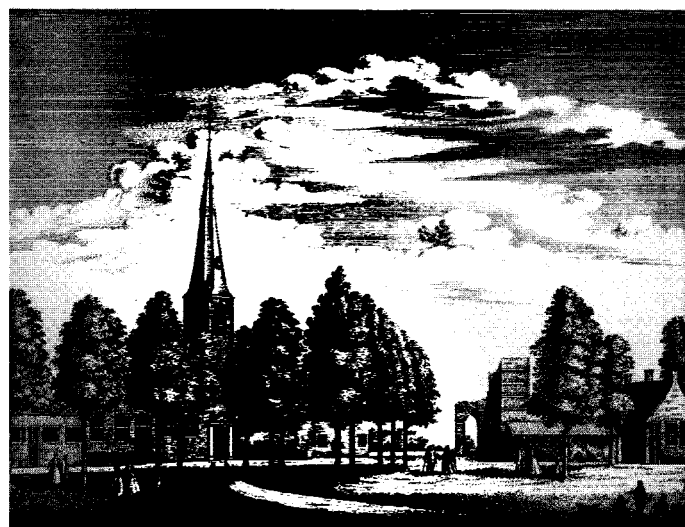
Tekening uit 1732. Rechts de ruïne van de abdij van Rijnsburg, die bij het beleg van Leiden werd verwoest. Links de (nu Hervormde) kerk uit 1578 met de toren van de 12 e eeuwse abdijkerk.